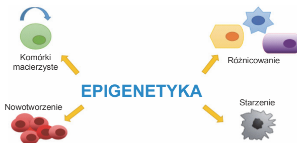
Ryc. 3. Wpływ mechanizmów epigenetycznych na regulację procesów komórkowych

Niektóre z chorób psychicznych mogą mieć również podłoże w zmianach epigenetycznych. Pośmiertna analiza tkanki mózgowej pacjentów ze schizofrenią i chorobą afektywną dwubiegunową wykazała różnice w poziomie zewnątrzkomórkowego białka reliny związanego z plastycznością synaptyczną. Wykazano, że u pacjentów ze schizofrenią na skutek hipermetylacji promotora genu kodującego relinę poziom ekspresji jest znacząco niższy niż u grupy kontrolnej. Natomiast w przypadku genu COMT, kodującego enzym degradujący katecholaminy, zaobserwowano hipometylację promotora, co powoduje, że enzym jest bardziej aktywny w płacie czołowym zarówno u pacjentów ze schizofrenią, jak i z chorobą afektywną dwubiegunową (Grayson, 2005).